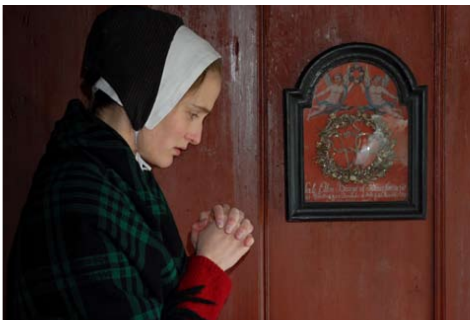
På mange gårde på Frilandsmuseet hænger mindetavler over afdøde. Det var en måde at huske de døde på. Det var ikke kun voksne, også børn har fået fine mindetavler.

Dødsvarslerne spillede en særlig rolle. Der kunne tages varsler af alt fra strå over kors til kragefugle på taget. Mange af disse varsler er nok blevet glemt igen, når de ikke gik i opfyldelse. Andre varsler var mere uhyggelige. Hvis man om aftenen eller natten på bestemte veje mødte det usynlige ligtog, som bevægede sig mod kirken, eller så en hvid skikkelse, kunne være det være et varsel om ens egen død eller døden for et medlem af familien. Det var særligt personer født på søndage eller helligaftener, som kunne se dem. For andre var det blot en fornemmelse eller uro hos hestene, når de usynlige døde kom forbi. Mere dramatiske varsler var når man mødte den tre-benede Helhest eller Kirkelammet. Det var sikre tegn på død.