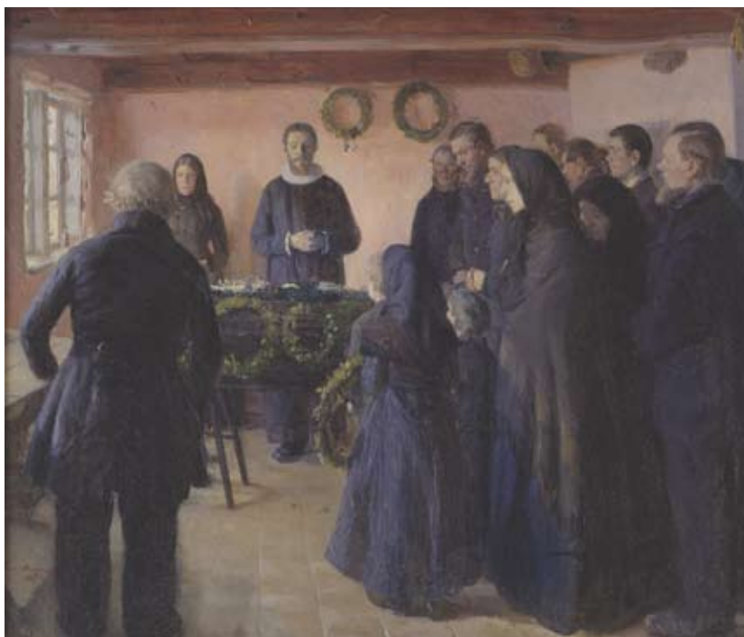
Ved den lukkede kiste beder præsten en stille bøn. Det er udsyngningen fra hjemmet, der er startet. Kisten er dækket med grønne kranse, som familie og venner er kommet med. Maleri af Anna Ancher: En begravelse (Statens Museum for Kunst)