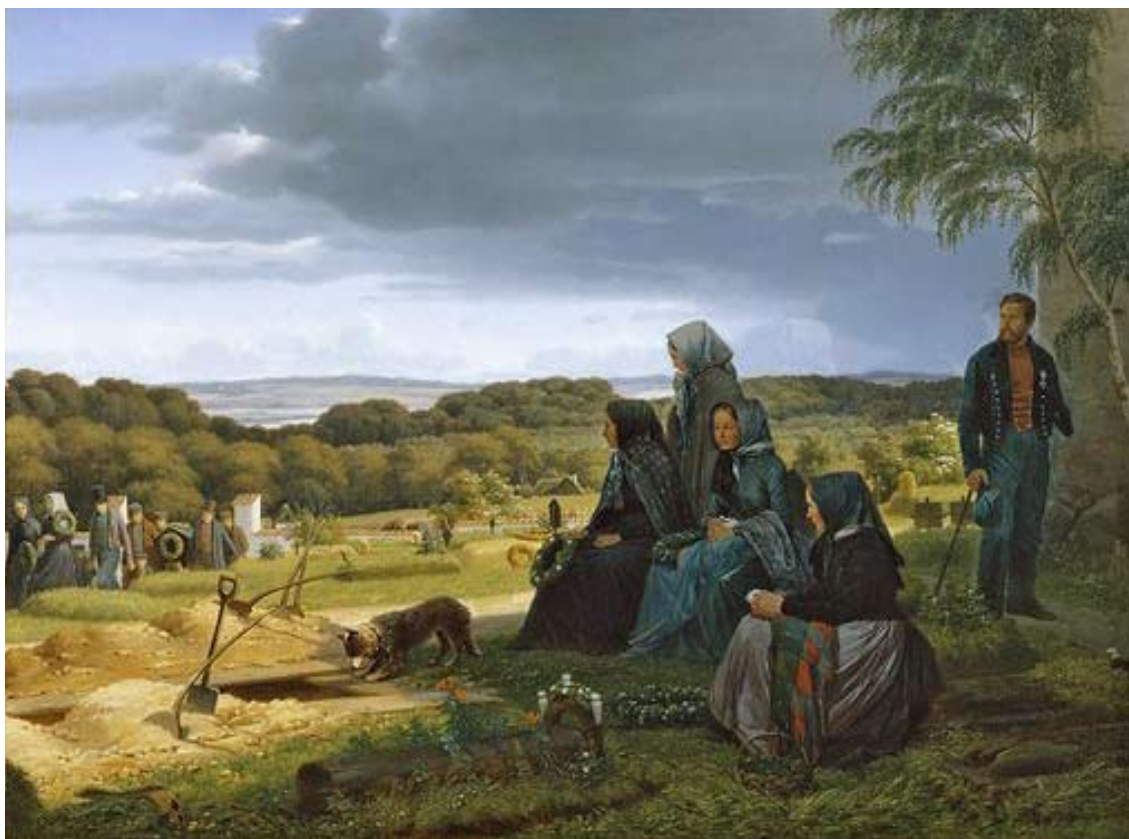
På kirkegården venter de sørgende ved graven sammen med den trofaste hund. Bagved kan man se kisten og ligfølget, som er på vej. Maleri af Jørgen Sonne: En ligfærd (Århus Kunstmuseum)

Nu kunne den fest fortsætte, som var blevet startet med udsyngningen om morgenen. Alle tog tilbage til gården, hvor festlighederne fortsatte i 2 dage. En begravelses hæderlighed afhang af, om der havde været rigeligt at spise og drikke, og om den havde varet længe. Begravelsesgildet foregik i storstuen, hvor kisten med den døde havde stået. Her var der blevet dækket op til middagsmad. Skafferen modtog igen gæsterne med et glas brændevin og