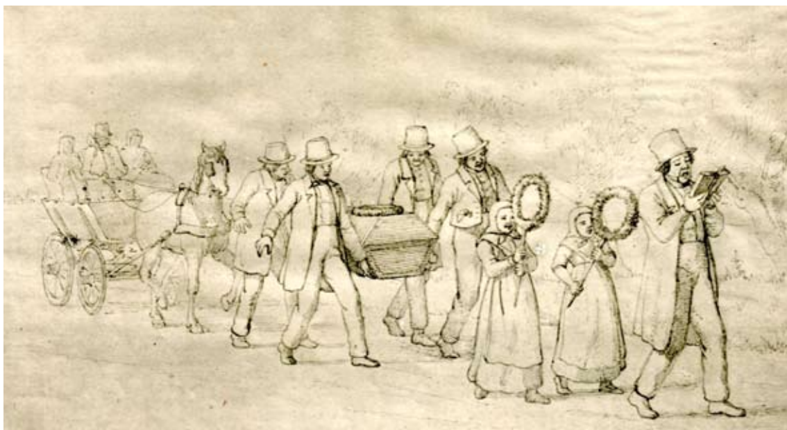
Ligtoget bliver ført an af degnen, som synger for. Bagved går 2 piger med grønne kransse. Det sorte kiste bliver båret af 4 mænd. Familien sidder i vognen bag kisten. Tegning af Julius Exner 1866. (Nationalmuseet)