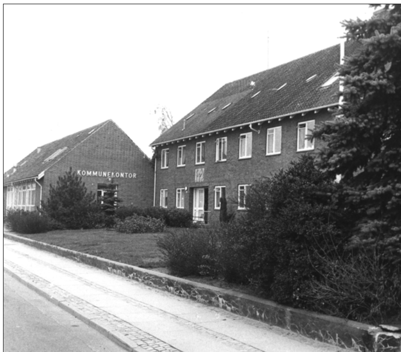
Kommunekontoret blev bygget i forlængelse af plejehjemmet i Støvring

Støvring by - oprindeligt en lille landsby mindre end eksempelvis Sørup - begyndte for ca. 100 år siden at vokse. Efterhånden blev det en stor by, en stationsby, der pga. sin størrelse blev udpeget til administrativt centrum for storkommunen og tillige gav kommunen navn.