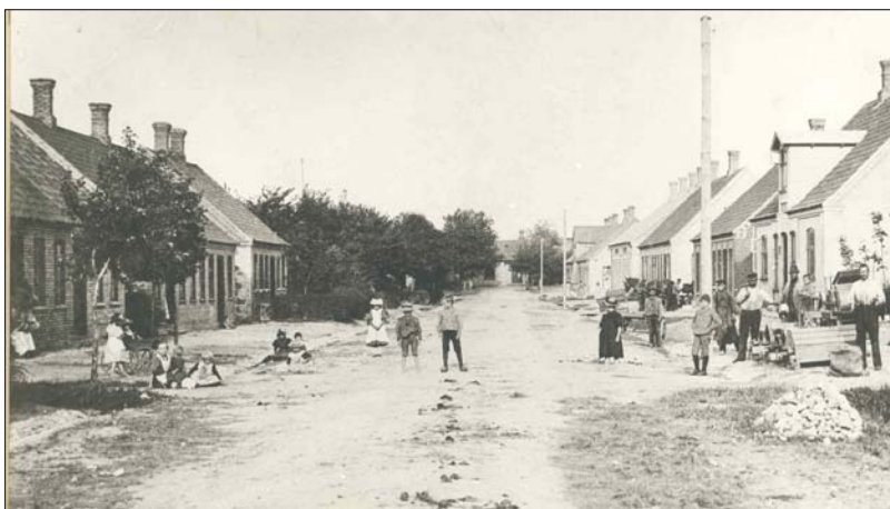
Jernbanegade i Støvring før 1882

skaber et brand- og dirkefrit skab". Tre år efter vedtog man at yde hjælp til sogerådsformandens arbejde, kr. 217,20. Først efter 2. verdenskrig opførte man i flere tempi kommunkontoret ved Hobrovej på et areal, hvor der omkring 1900 endnu lå en smededam. Kommunkontoret blev i 1970 overtaget af storkommunen.