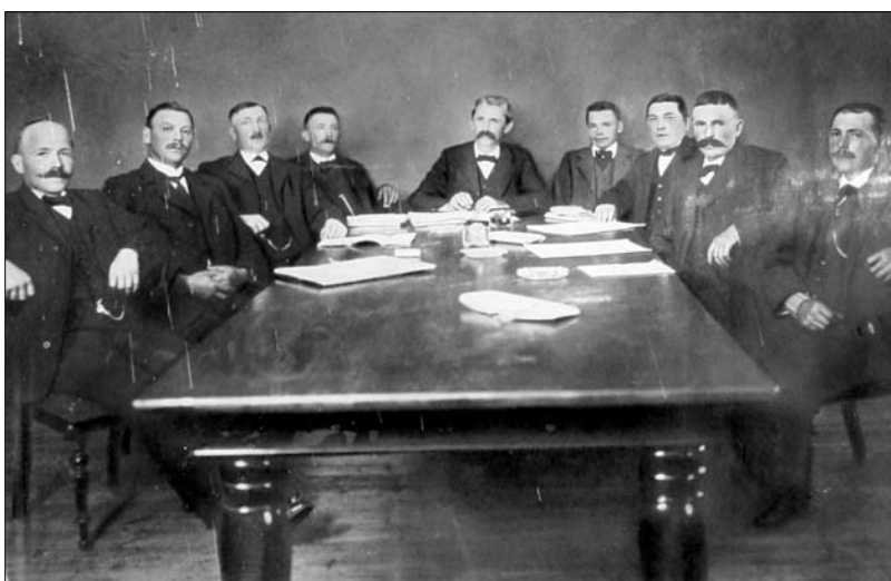
Buderup-Gravlev sogneråd 1913-17

M.h.t. socialudgifter betød stationsbydannelsen ingen forøgede udgifter for Buderup - Gravlev kommune før 1900. Omkring århundredskiftet var ca. 87 % af beboerne i Støvring stationsby tilflyttere, og de var forsørgelsesberettiget i deres oprindelseskommune. M.h.t. skoleudgifter mærkede gårdmændene i Buderup - Gravlev sogneråd derimod, at Støvring stationsby voksede. Det blev nødvendigt i 1880'erne at nedlægge den stråtækte skole (nuværende "Kosangas" på Hobrovej) ved den gamle Støvring landsby. En større med to lærere blev anlagt, hvor nu Bavnebakkeskolen ligger, dvs. nær det sted, hvor stationsbyhuse skød op, (Jernbanegade).