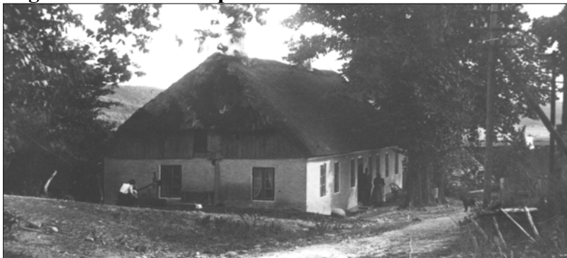
Sognerådet havde blandt andet ansvar for skolen i Gravlev

Landkommunerne begyndte at tage form i løbet af 1800-tallet. Fra 1803 skulle sognets beboere betale penge til en fælles fattigkasse, og efter 1814 blev landboerne også pålignet skoleskat. Fattigkassen og skoleskatten, som blev betalt fortrinsvis af folk med formue eller jord, dvs. i første række gårdmænd og lokale godsejere, blev i første halv-