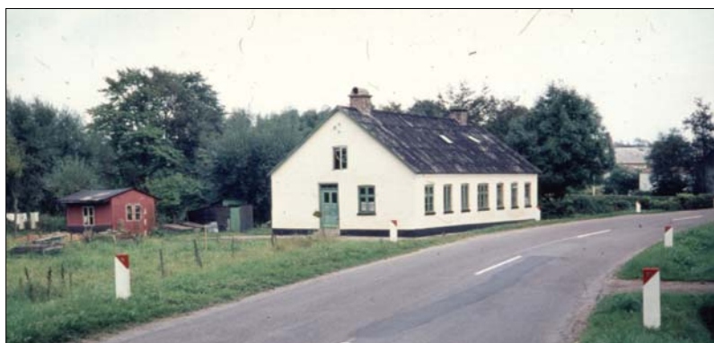
Øster Hornum fattighus fra 1901 kort før det blev raget ned i 1964

Sogneforstanderskabet i en af de største sognekommuner i Himmerland, nemlig Aarestrup, blev bl.a. ledet af en Niels Krabsen. Møderne blev ofte holdt i Gravlev skole. I 1864 søgte man indenrigsministeriet om at måtte blive opdelt i tre selvstændige sognekommuner: Aarestrup, Buderup (Støvring - Sørup) og Gravlev. Ministeriet afviste ansøgningen med den begrundelse, at de tre kommuner ville blive for små, men man ville godtage en opdeling i to: Aarestrup og Buderup - Gravlev. Kommuneadskillelsen trådte i kraft pr. 1/1 1866. Kommunearkivet med sager helt tilbage til 1803 skulle overtages af den største sognekommune, Buderup - Gravlev. Derimod blev kommunekassen delt, og der blev gjort status over fattiglemmer: 9 i Aarestrup, 11 i Buderup og 20 i Gravlev. Antallet af fattiglemmer i Buderup - Gravlev kommune var efter kommunedelingen i 1866 forholdsvis stort, og udgifterne tilsvarende store.