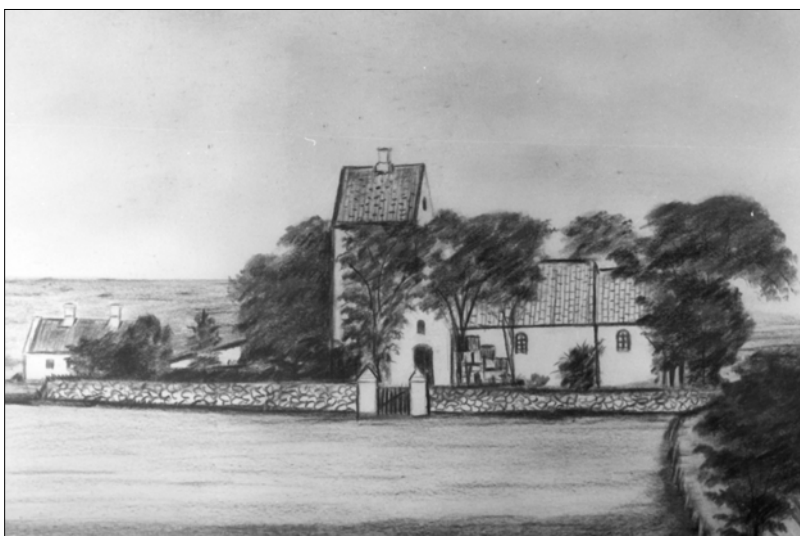
Sogneinddelingen tilbage fra middelalderen lå til grund for de ny sognekommuner. Her tegning af Buderup Kirke

del af 1800-tallet administreret af hver sin styrelse. Først i 1841 opstod sognekommunerne, og fattig- og skolevæsenet blev samlet under en overordnet ledelse, de senere sogneråd. Men den nuværende storkommunes socialforvaltning og skoleforvaltning har altså rødder tilbage til begyndelsen af 1800-tallet, for socialforvaltningens vedkommende helt tilbage til 1803. Ledelsen af fattigvæsenet i Aarestrup - Buderup - Gravlev foretog som en af sine første handlinger en indretning af loftet på Støvring skole (nu "Kosangas" på Hobrovej) Loftet skulle bruges til opmagasinering af korn til de fattige. En tredje lokal byrde var vedligeholdelsen af veje og broer. I første halvdel af 1800-tallet og før blev vedligeholdelsesarbejdet udført af sognets beboere. Først efter oprettelsen af sognekommuner i 1841 blev det mere og mere almindeligt at udlicitere arbejdet og i stedet dække de dermed forbundne udgifter over kommunekassen.